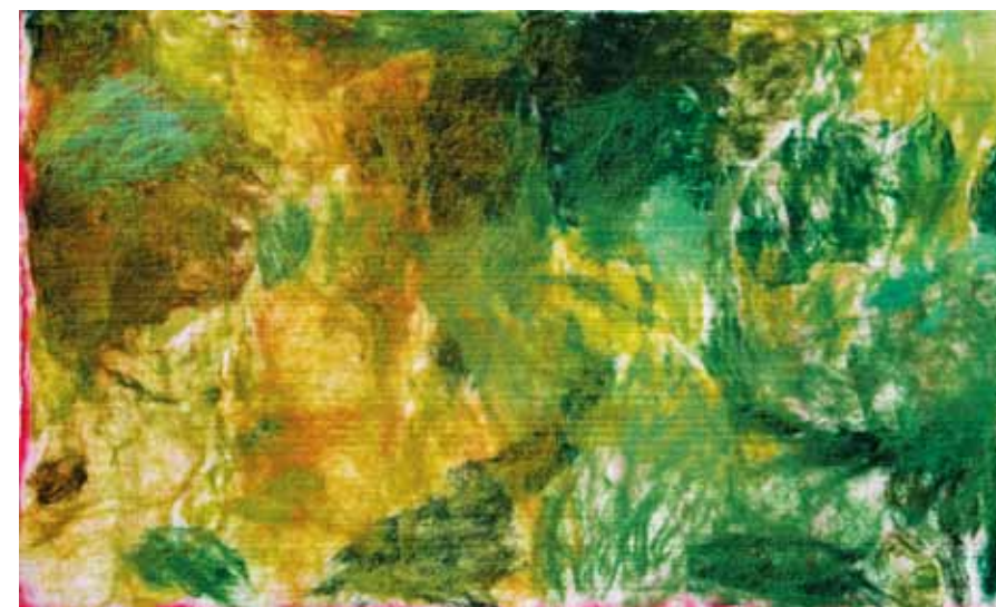
RASA LEONAVIČIŪTĒ. Dvaro parke I, II. Veltinis, dažymas, 78×128 cm