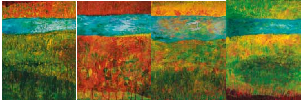
KAROLINA KUNČINAITĖ. Virinta. Drobė, aliejus, 40×120 cm