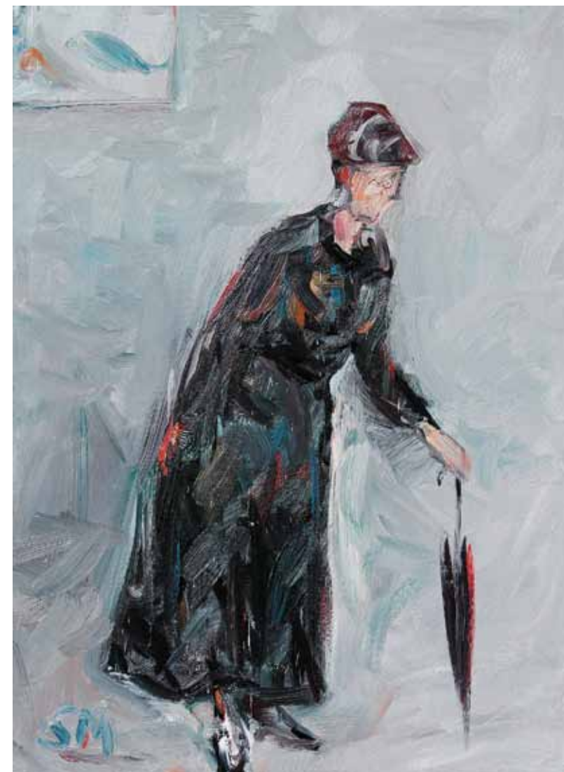
SIGITA MASLAUSKAITĖ. Ponia. Drobė, aliejus, 130×95 cm