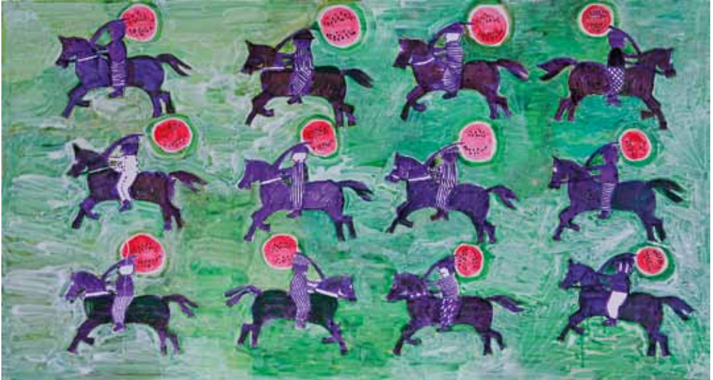
AUSTĖ JURGELIONYTĖ-VARNĖ. Žaidimų kambarys III. Drobė, akrilas, 70×130 cm