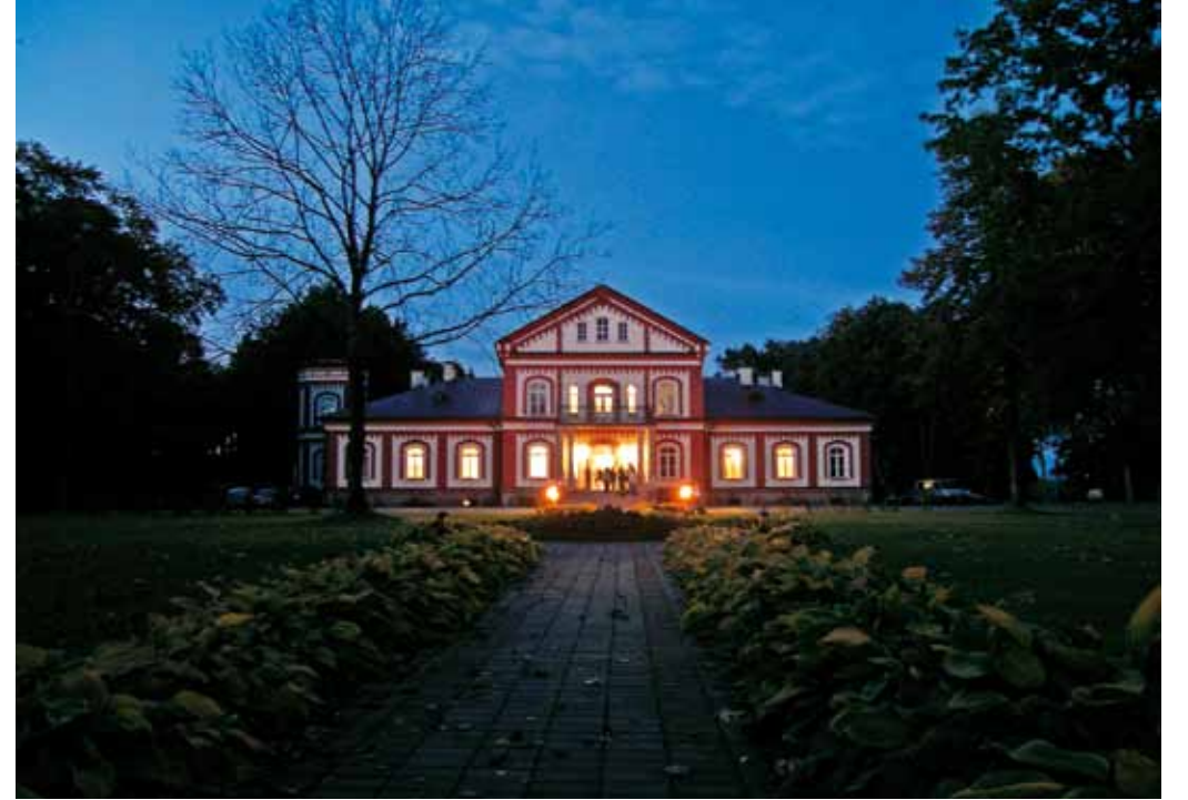
LINAS PUSVAŠKIS. Alantos dvaras. Fotografija