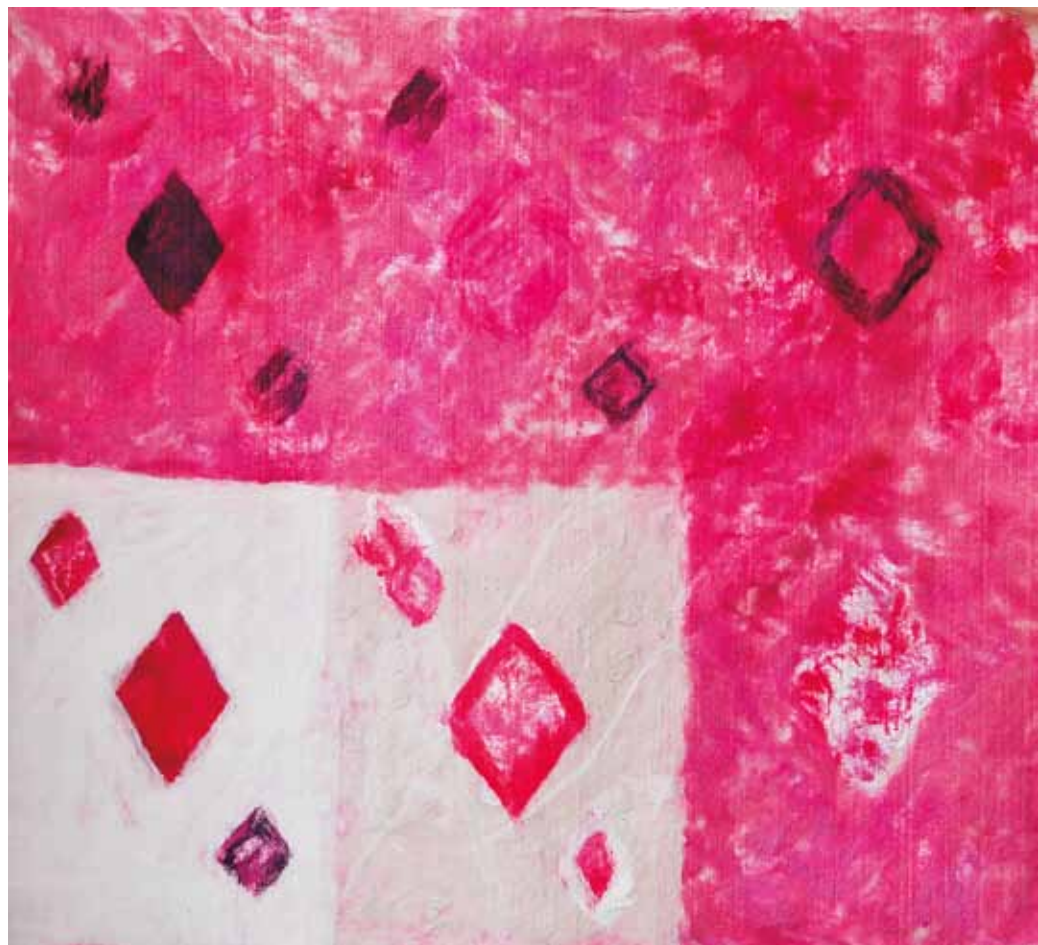
RASA LEONAVIČIŪTĖ. Pavésinė, arba Tūzai. Veltinis, dažymas, 140×155 cm