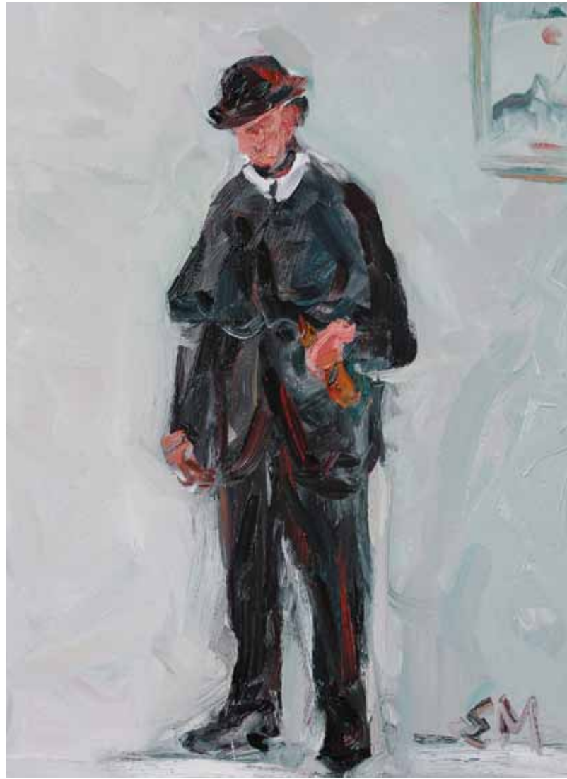
SIGITA MASLAUSKAITĖ. Ponas. Drobė, aliejus, 130×95 cm